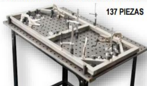
KIT PARA SUJETAR ESTRUCTURAS CUADRADAS Y REDONDAS MOD. TCK200 PRECIO: 740.00 USD. + I.V.A.