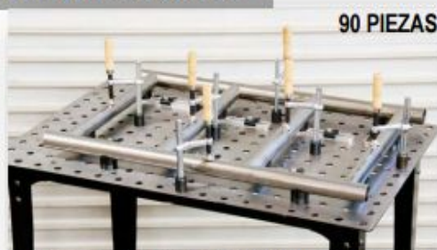
KIT PARA SUJETAR ESTRUCTURAS CUADRADAS Y REDONDAS MOD. TCK100 PRECIO: 496.00 USD. + I.V.A.