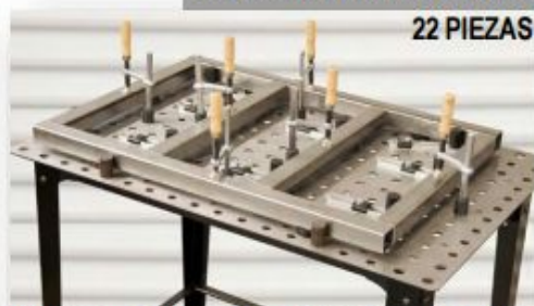
KIT BASICO ECONOMICO PARA ESTRUCTURAS REDONDAS Y CUADRADAS MOD. TCK100-1 PRECIO: 138.00 USD. + I.V.A.