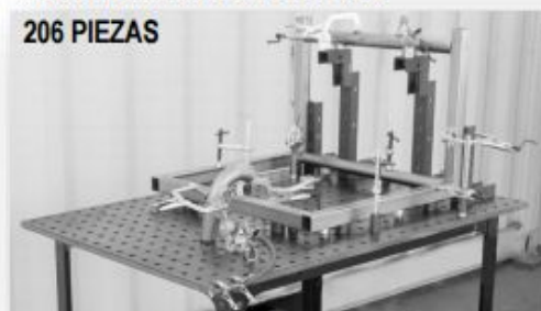
KIT PARA ENSAMBLES DE ARMAZONES EN 3D MOD. TCK320 PRECIO: 1120.00 USD. + I.V.A.